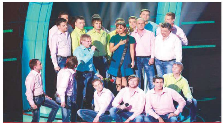
ОКТАБРЬ. НАШИ В ТЕЛЕШОУ «БИТВА ХОРОВ»