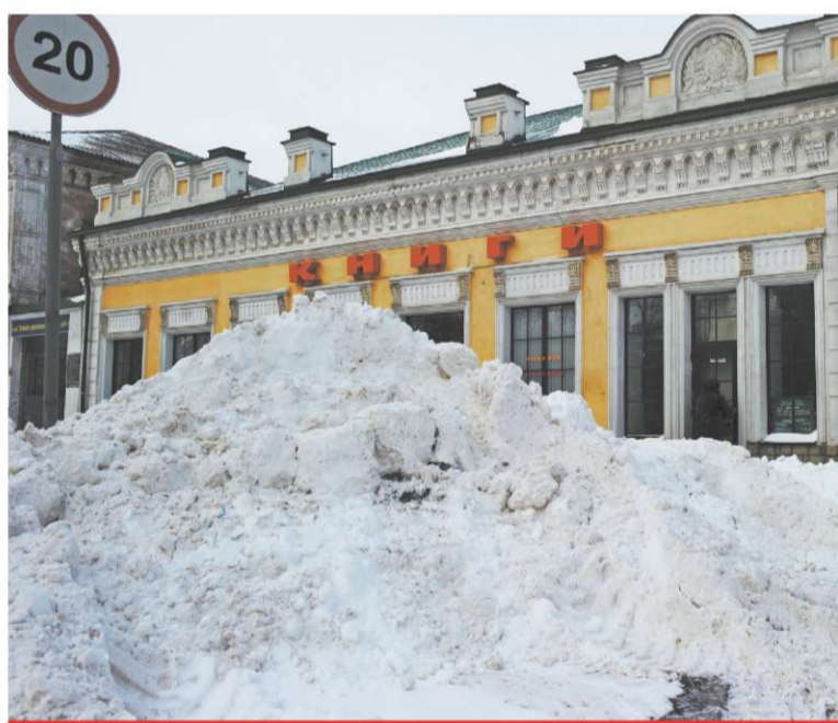
МАРТ. НА ГОРОД ЗА ДЕНЬ ВЫПАЛО 16 СМ СНЕГА