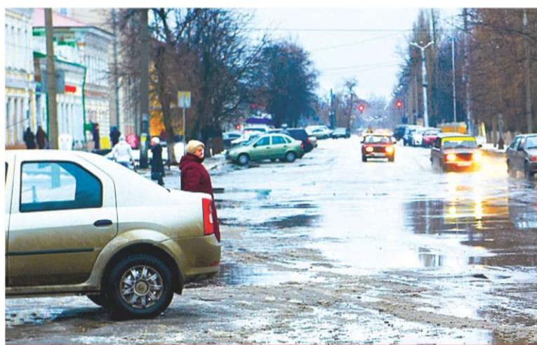
ФЕВРАЛЬ. ПОГОДА ИСПЫТЫВАЛА ВСЕХ «НА ПРОЧНОСТЬ»