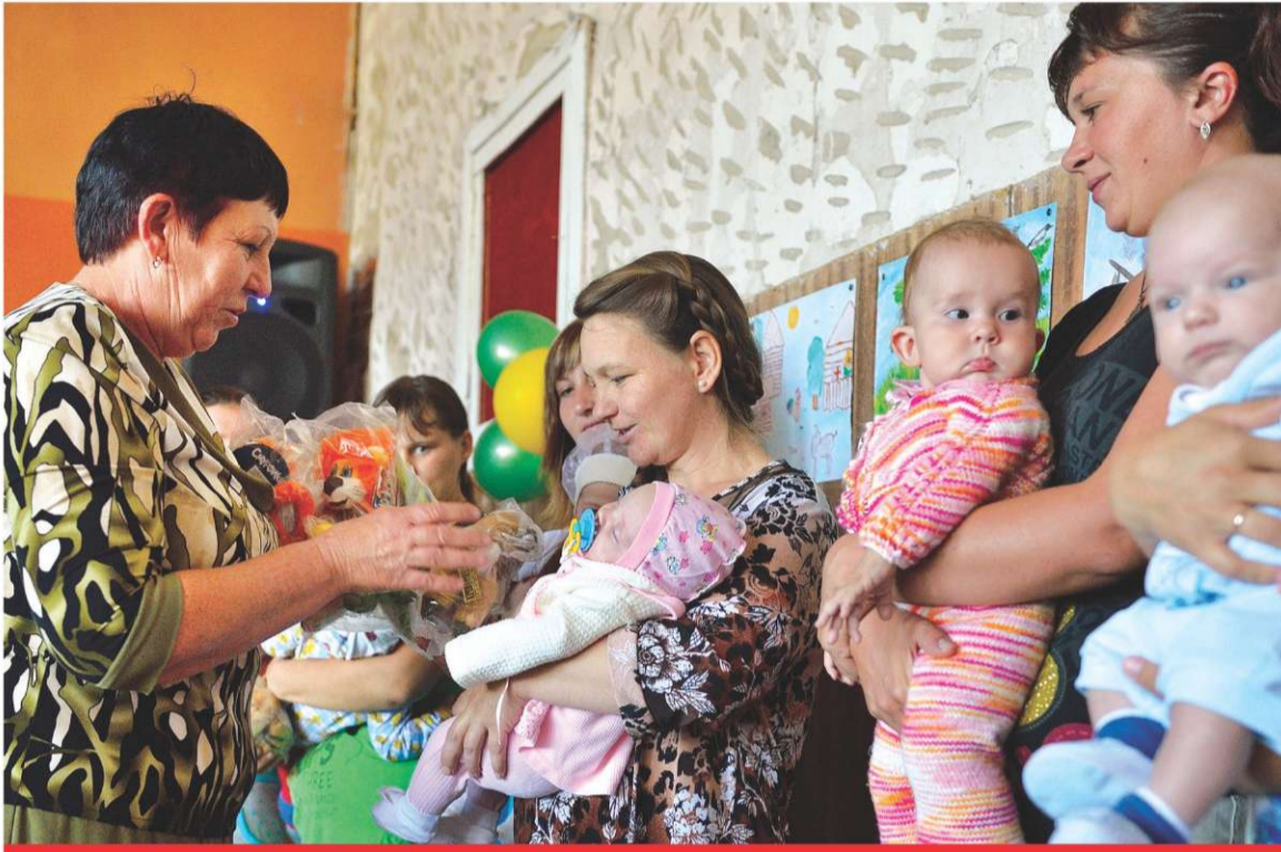
АВГУСТ. В ГОД 215-ЛЕТИЯ СЕЛА УЛЬЯНОВКИ В МОЛОДЫХ СЕМЬЯХ РОДИЛОСЬ 10 ДЕТЕЙ