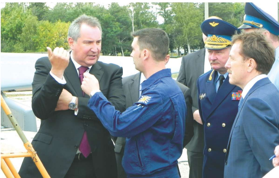
СЕНТЯБРЬ. ДМИТРИЙ РОГОЗИН И АЛЕКСЕЙ ГОРДЕЕВ ПООБЕЩАЛИ ВОССТАНОВИТЬ ЛЕТНОЕ УЧИЛИЩЕ