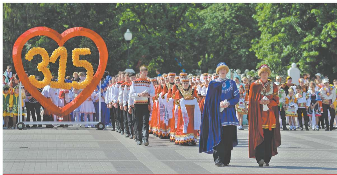
МАЙ. БОРИСОГЛЕБСК ОТМЕТИЛ 315-Й ДЕНЬ РОЖДЕНИЯ