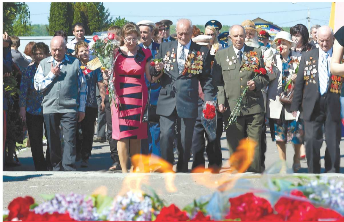
МАЙ. А ПАМЯТЬ СВЯЩЕННА... ВОЗЛОЖЕНИЕ В ДЕНЬ ПОБЕДЫ