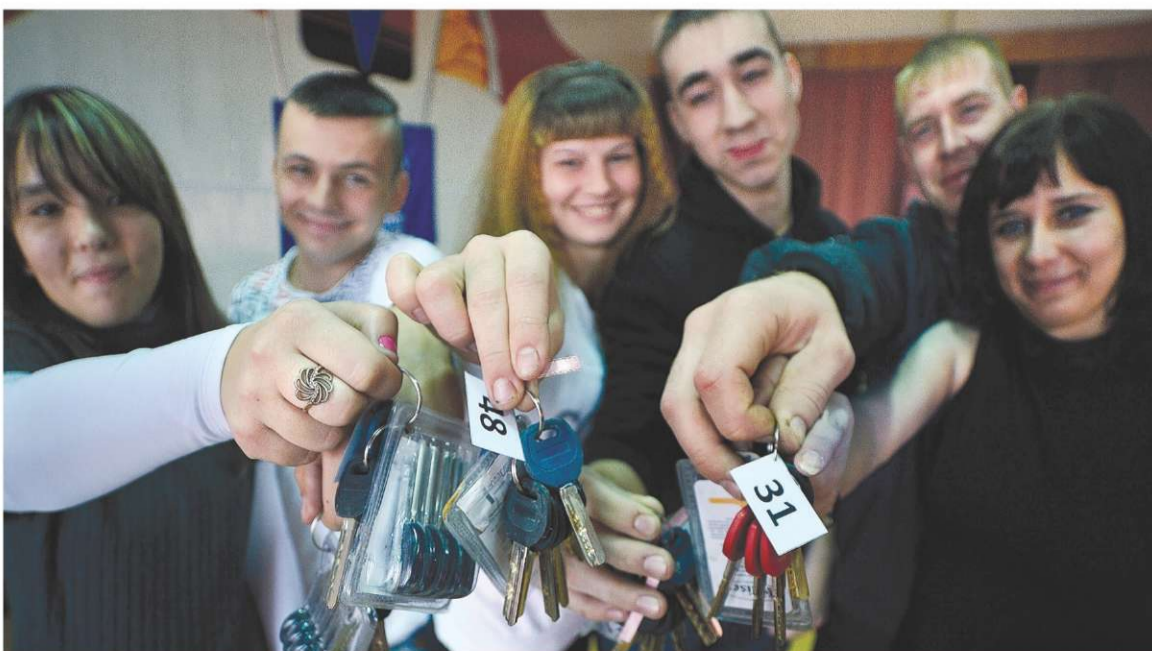
ОКТАБРЬ. 36 ДЕТЕЙ-СИРОТ ИЗ СЕМИ РАЙОНОВ ОБЛАСТИ ПОЛУЧИЛИ КВАРТИРЫ В БОРИСОГЛЕБСКЕ