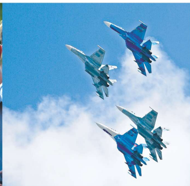
ИЮЛЬ. БОРИСОГЛЕБЦЫ И ГОСТИ ГОРОДА УВИДЕЛИ ГРАНДИОЗНОЕ АВИАШОУ, ПОСВЯЩЕННОЕ 90-ЛЕТИЮ БОРИСОГЛЕБСКОЙ ВОЕННОЙ ШКОЛЫ ЛЕТЧИКОВ