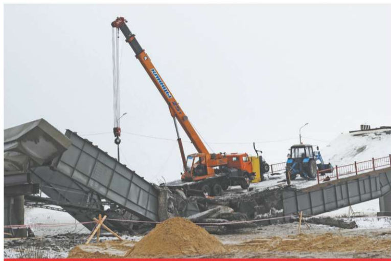
ЯНВАРЬ. ОБРУШЕНИЕ МОСТА ЧЕРЕЗ РЕКУ ВОРОНА

Завершается еще один год. У каждого о нем останутся свои воспоминания. Мы предлагаем вместе вспомнить о том, что происходило в округе в этом году, пролистав подшивку «Борисоглебского вестника».