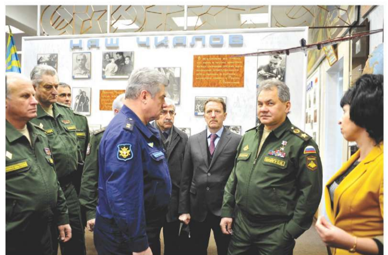
ДЕКАБРЬ. СЕРГЕЙ ШОЙГУ НА БОРИСОГЛЕБСКОЙ АВИАБАЗЕ